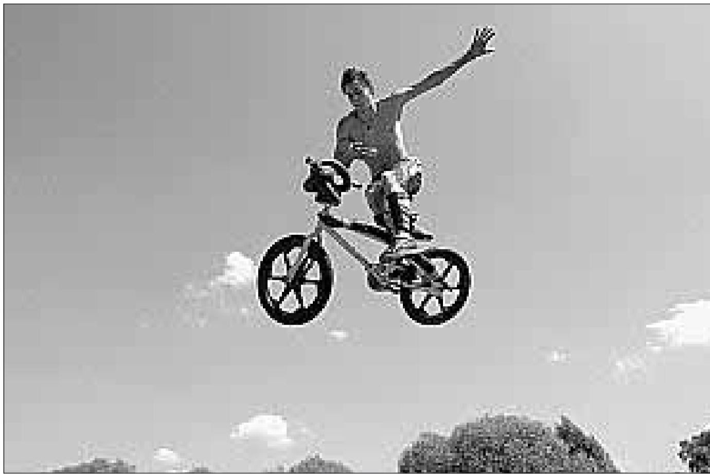
Tolle Flugphase: Die Schar der BMX-Akrobaten wächst. Jetzt sollen sie in Falkensee ihre feste Heimstatt finden.

BRIESELANG ■ Die Anmeldung der Schulanfänger der Gemeinde Brieselang erfolgt wahlweise in der Robinson-Grundschule, Karl-Marx-Straße 130 oder in der Zeebr@-Grundschule, Marie-Curie-Straße 2. Die Anmeldungen können von den Eltern am 15., 18. und 23. Januar vormittags von 9 bis 12 Uhr vorgenommen werden; am 16. und 25. Januar von 9 bis 12 Uhr sowie von 14 bis 18 Uhr. Anmeldungen für den Hort „Pustebume“ werden zu den oben genannten Öffnungszeiten in der Zeebr@-Grundschule entgegengenommen. Anmeldeformulare für den Robinson-Hort werden zu den genannten Sprechzeiten in der Robinson-Grundschule ausgehändigt und sind im Hort, Bahnstraße 58/59 abzugeben. MAZ